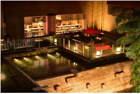
京都東急ホテル(京都)