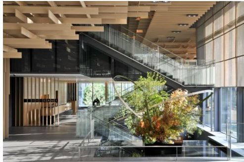
ザ・キャピトルホテル東急(永田町)